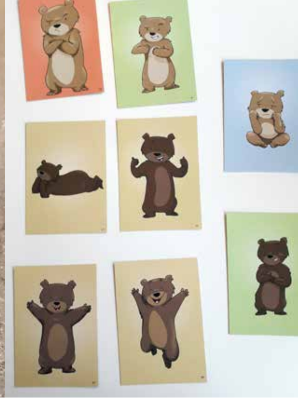
Lapset antoivat palautteensa osallisuus- työpajasta Nalle-kortteja valitsemalla.